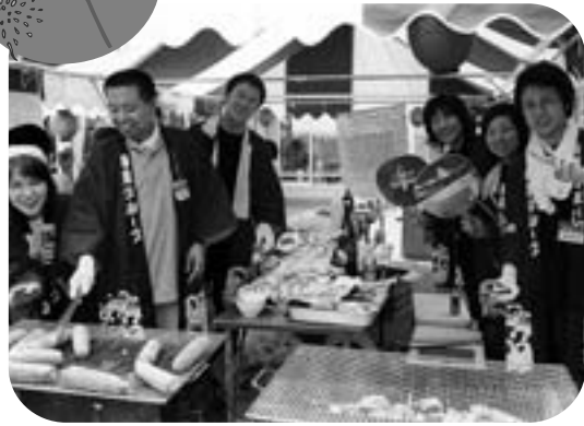
今年どんな物が出てくるか...お楽しみに!

毎年恒例になっています、「有明海・くじら祭り」を7月23日(土)に開催いたします。地域の皆様との交流の場として夏のひとときを、有意義にそして楽しく過ごせますよう、天寿園職員一体となっても意気込んでいます。また人気イベントの『バザー』を今年も実施します。地域の皆様には毎年お世話になりますが、ご家庭の不要な物のご提供にご協力頂きたいと存じます。ご連絡頂きますとお伺い致しますので、どうぞよろしくお願い申し上げます。最後になりますが、本年も皆様方多数のご来園を心よりお待ちしております。