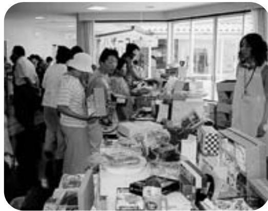
いつも盛況なバザー風景

詳しくはチラシにて地域の皆様にはお知らせ致します(写真は平成16年・夏祭りの様子です)