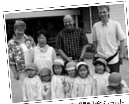
奥古閑保育園訪問記念ショット

ご両親は、「我が息子は本当に素晴らしい所、優しい人々に囲まれてとても安心しました。また私達も来日、来熊でき幸せです」と言われていました。