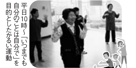
平日10時~11時までも自分のことは自分で!を目的としたがる運動

そんな想いから、天寿園あきたの家にて体操教室を始めました。ぜひ、体を動かすに、お食事に、お話をしに、遊びにいらしてください。