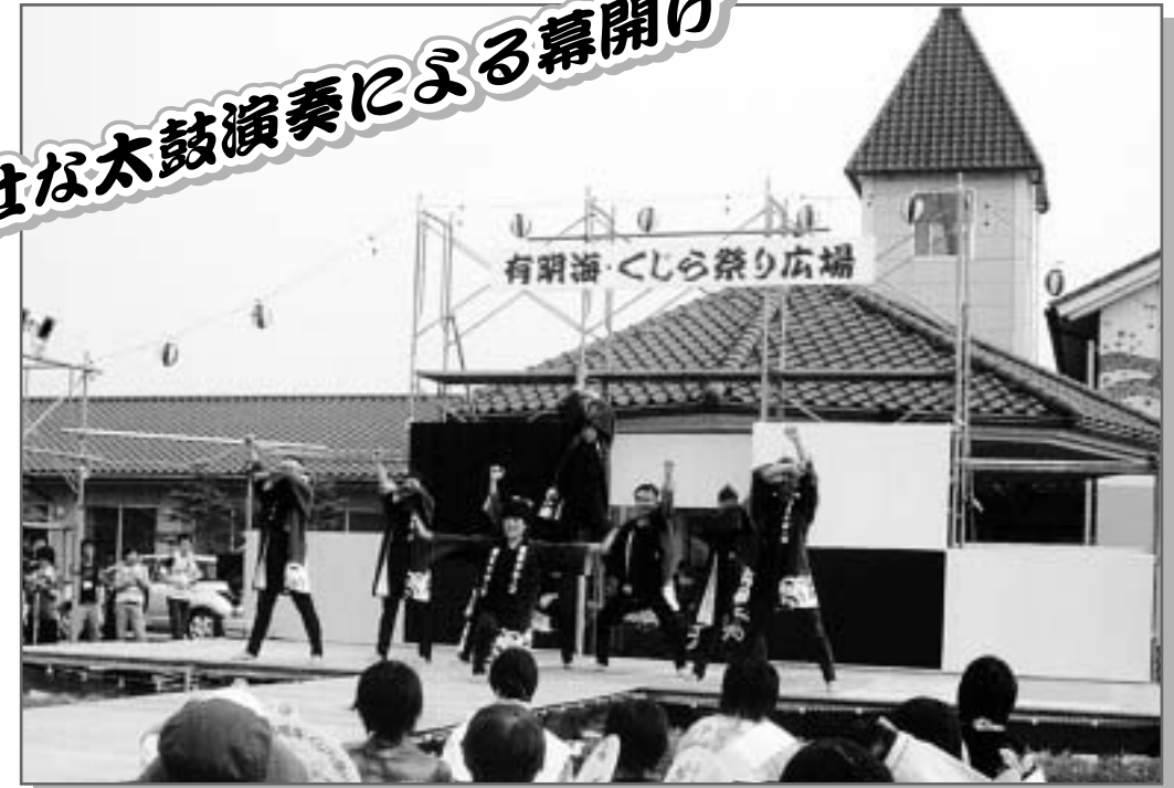
エイ、ヤ、サササ! 威勢のいい踊りです

当日は、夕暮れの涼しい風が吹く中、地域の皆様・ボランティアの皆様合わせて1200名あまりの方々にご来園いただき、大盛況の賑わいとなりました。 オープニングは「天翔太鼓様」による、勇壮な太鼓の演奏で幕開け、その後も、歌や踊り、クリニック・天寿園職員による踊り、パフォーミングス豊かな司会に盛り上がりも格別でした。