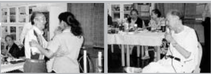
昔を思い出しながら、たのしく、しみじみと.....

今年も猛烈に暑い夏がやってまいりました。これでもか...とジリジリと照り続ける太陽! 寝苦しい夜!! もうたまりません、もう待てません、ビールが。という訳で恒例の「ビアパーティー」を開催。