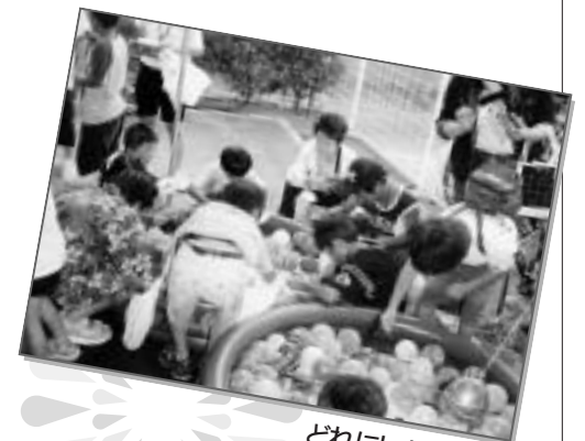
どれにしようかな?

また、毎年ご好評いただいているバザーを始め、模擬店では開始から20分30分で売り切れになる所もあり、たくさんの方で賑わいました。ファイナルには、200発の打ち上げ花火をバックにご来園の方々、職員とが一つとなつて総踊りを行い、皆様最高の笑顔・感動の中閉会しました。